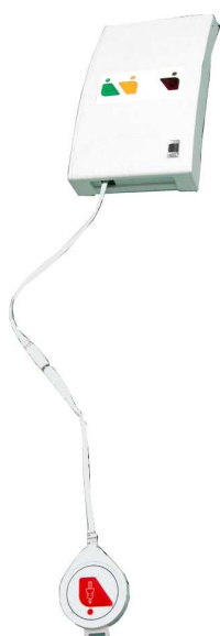
Émetteur mural EM2K