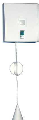
Émetteur mural à tirette sanitaire